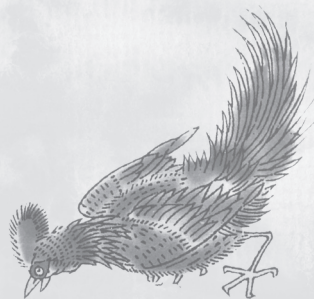
五彩鳥 (明·蔣應鑄圖本)